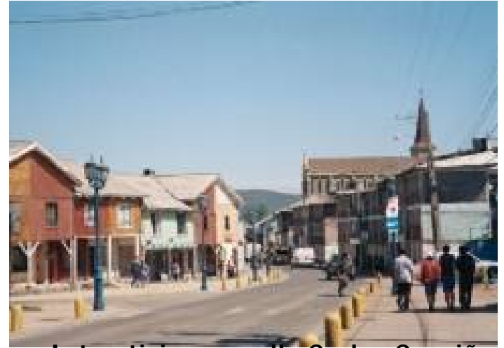
Intersticios en calle Carlos Cousiño