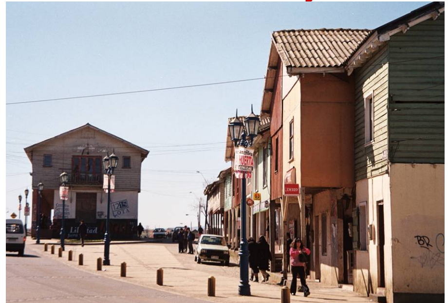
Espacios de encuentro en plazoleta y almacén

En este entorno, el habitante va y viene, se acerca y se aleja de los lugares, donde todo es domicilio, y en el cual se reconoce la condición humana de todos, y de cada cual, dándose una cotidianeidad reflexiva por el persistente reencuentro en lo propio del amplio domicilio, del cual no se desprende jamás. Lo lejano se conquista con la mirada, lo cercano con la familiaridad de los sonidos, los olores, los afectos y las inevitables complicidades de la proximidad en la vida diaria.