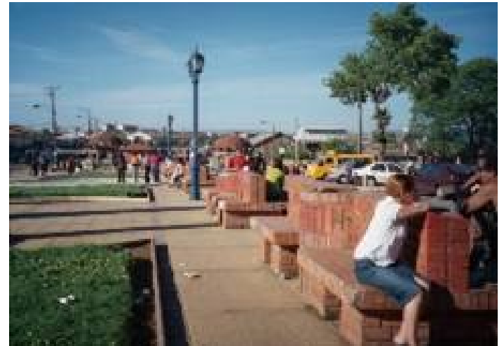
Plazoleta Escuela Thompson Matthews