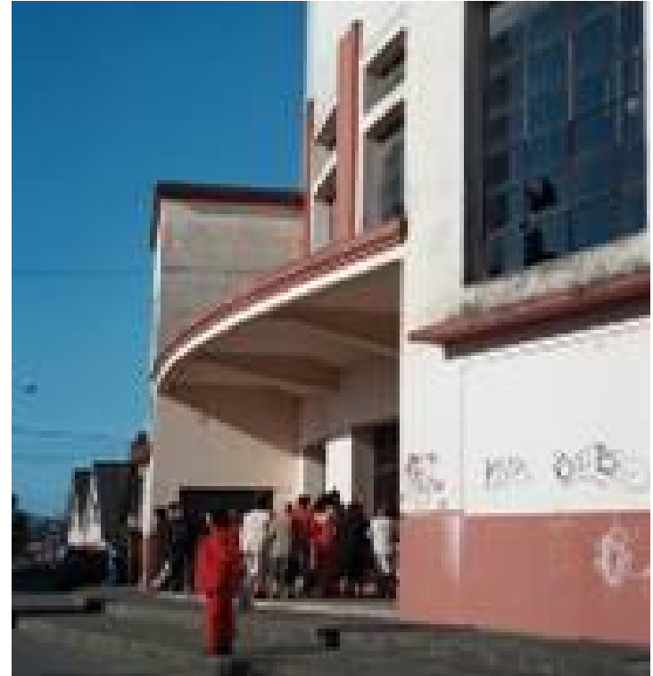
Atrio del Teatro y ensayo de la Banda