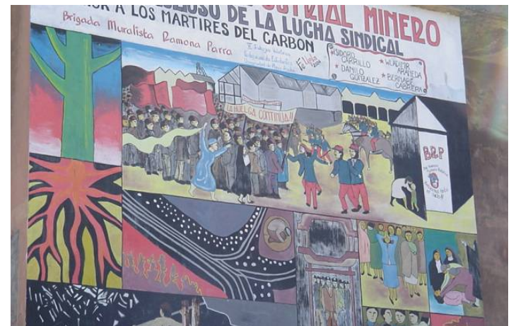
Mural del Sindicato minero de Lota