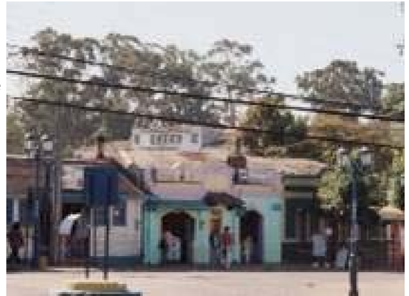
Fuente de Soda en calle Carlos Cousiño

El local, ubicado en la principal calle de Lota, une el pasado y el presente como preámbulo al Parque de Lota, otro espacio de profunda significancia cultural.