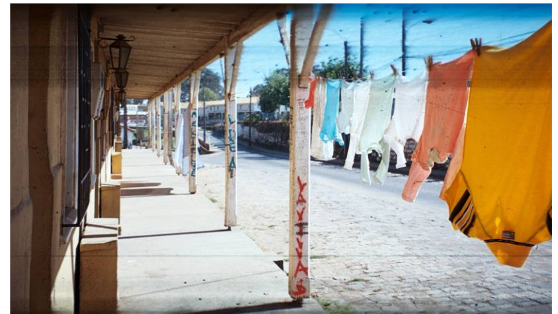
Ropa tendida en corredores