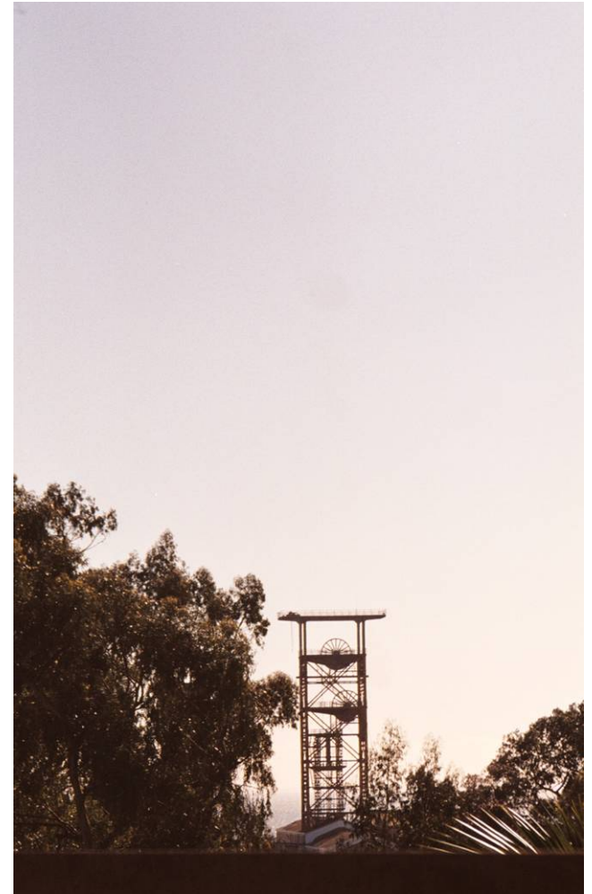
Gran Pique Carlos