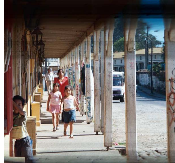
Uso público de los corredores

El vínculo entre lo público y lo privado se extendía hasta la mina porque los piques y galerías eran partes constituyentes del permanente ciclo comunitario.