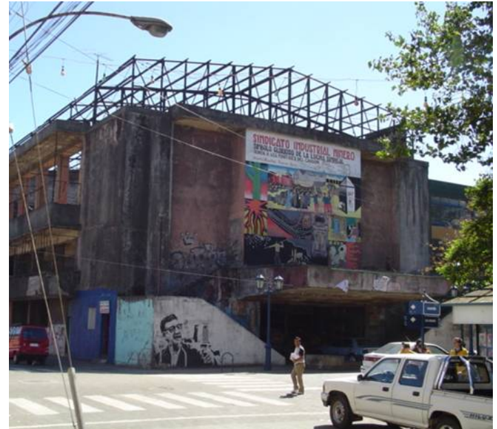
Sindicato minero de Lota