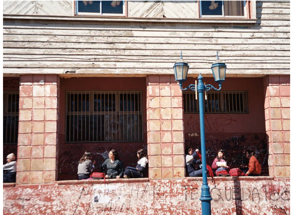
Encuentro espontáneo en la Casa de la Cultura

La red de lugares intersticiales que acogen la reiteración del encuentro espontáneo se multiplica por esquinas y rincones. Las barandas de algunos corredores actúan como soportes informales del encuentro y sirven de respaldo para la conversación y la espera de los residentes y los visitantes que comparten estos lugares de permanencia en torno a los cuales gravitan las confluencias y bifurcaciones de diversos destinos.