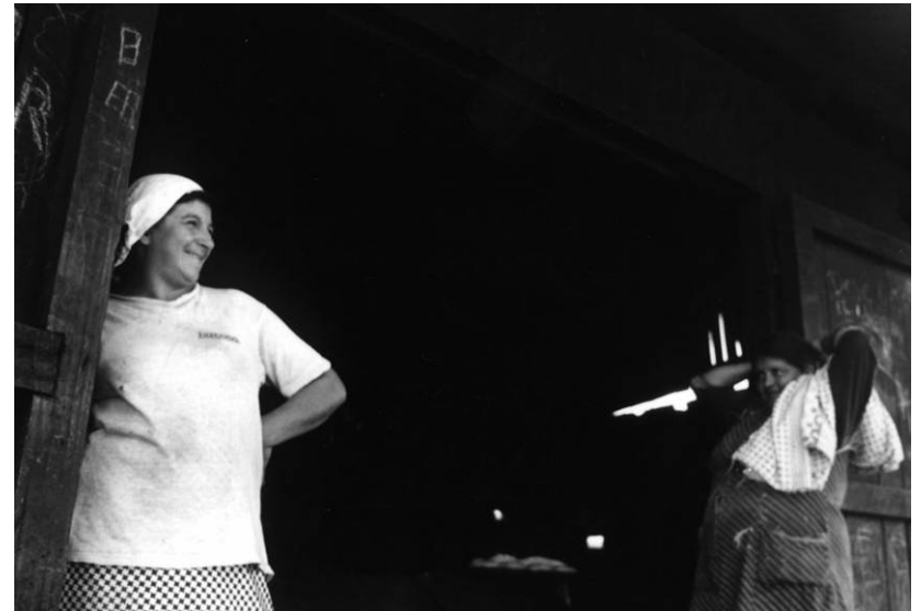
Esperando el pan de mina