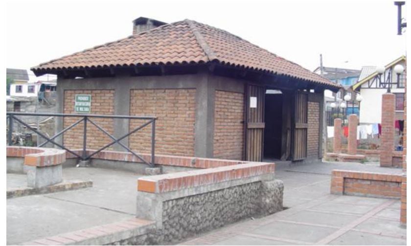
Horno en calle Loreto Cousiño